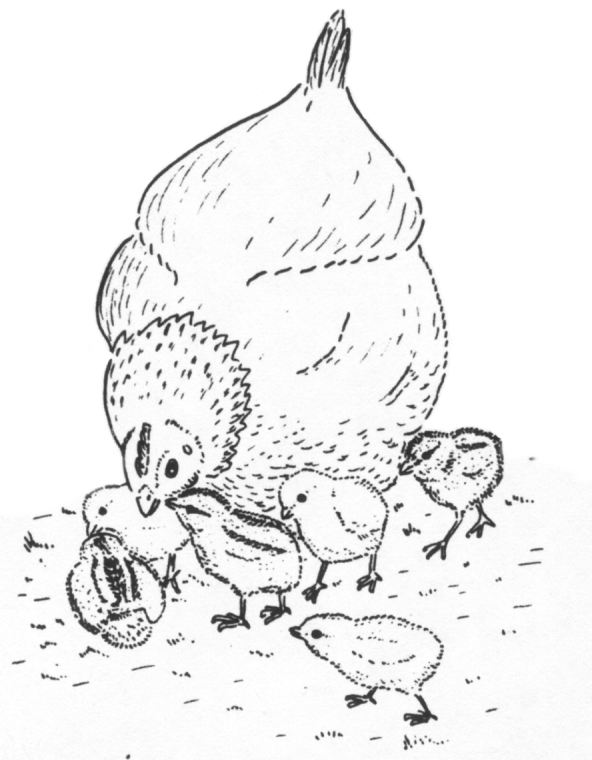
Hønen viser kyllingerne egnede fødeemner.

Får en kylling fat i et emne, der er for stort, og som evt. truer med at kvæle det lille kræ,