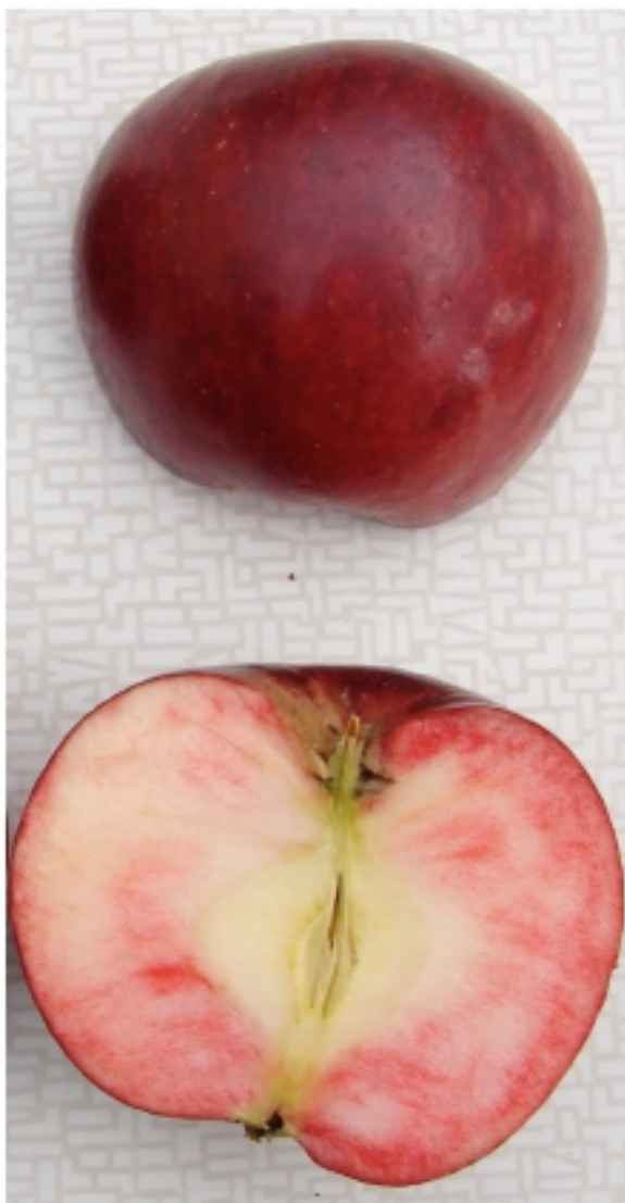
Arwen-æblet - ikke så gammelt! Men unikt med sin smukke røde farve.