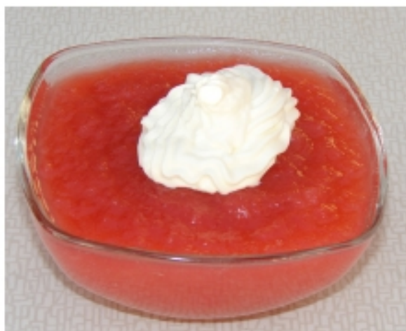
Arwen-æblet er lidt syrligt til spisebrug men giver flot æbleflæsk, råkost, kompot mm.