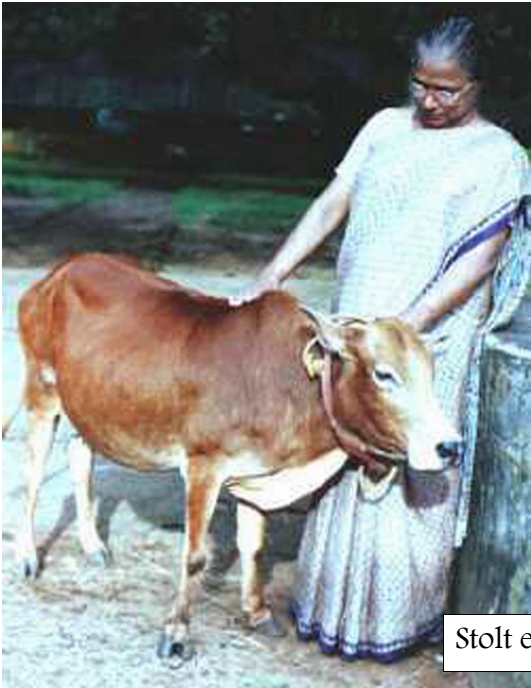
Stolt ejer med Vechur ko