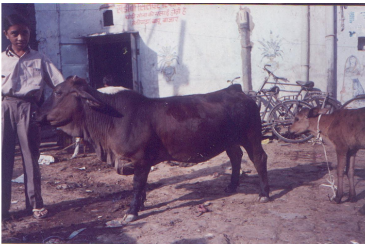
Nutidige Gaini kvæg.

I Indien er der ifølge Proff. Sandip Banerjee endnu en meget lille kvægrace, måske den mindste. Han beskriver racen sådan: Gaini racen er sandsynligvis den allermindste og har samme arvemønster som Kerry og Dexter. En interessant detalje er at racen er beskrevet i teksten "Babur Nama" fra 1590, også med navnet Gaini. Racen eksisterer stadig; men dyrene er temmelig oversete, og er endnu ikke grundigt beskrevet. Studier af deres produktivitet mm. mangler endnu.